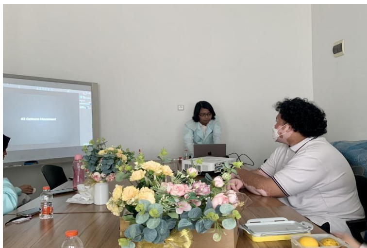
Gambar 2 Pembukaan Workshop