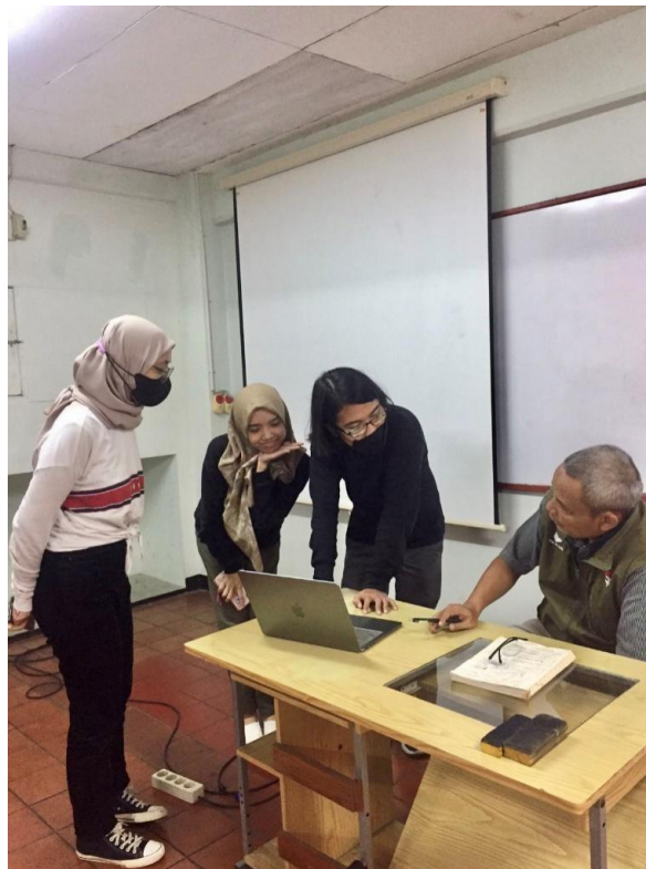
Gambar 1 Asistensi Proposal Awal