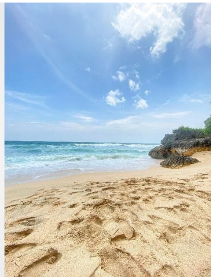
Gambar 4 Materi Fotografi

Angle foto sendiri merupakan sudut pengambilan tertentu yang diterapkan pada saat kamera akan membidik sebuah objek.