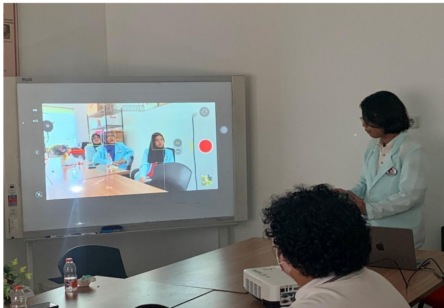
Gambar 3 Pemaparan Materi Fotografi