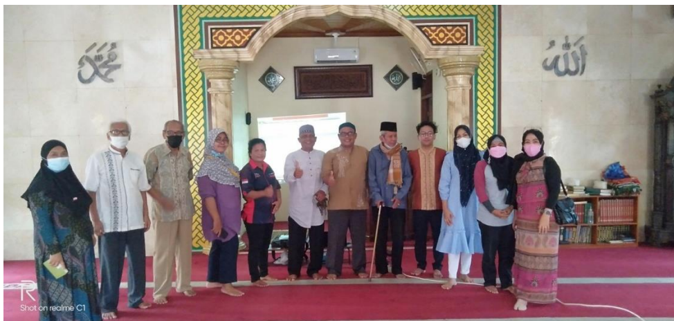
Sosialisasi Program Sistem Informasi RW 15 yang sudah selesai dengan pengurus RW dan RT (lanjutan)