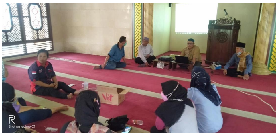
Sosialisasi Program Sistem Informasi RW 15 yang sudah selesai dengan pengurus RW dan RT