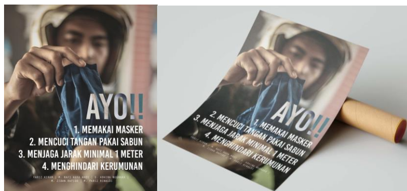
Gambar 1. Desain Poster 1