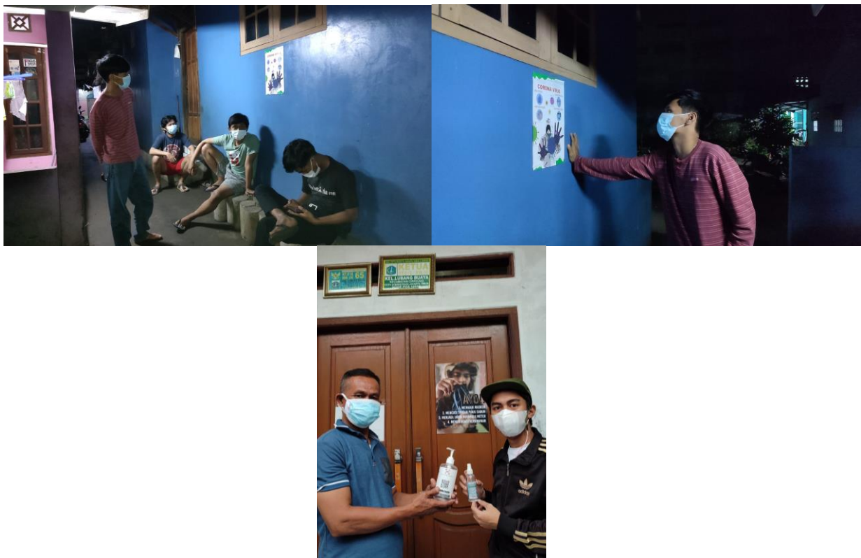
Gambar 3. Aplikasi Poster di Masyarakat

Desain poster yang sudah dibuat selanjutnya dicetak dan didistribukan dimasyarakat. Pendistribusiannya dilakukan dengan memasang poster ditempat yang sering dilewati masyarakat. Dengan melihat poster tersebut diharapkan masyarakat penduli dengan protokol kesehatan dimasa pandemi Covid-19.