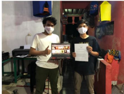
Gambar 3. Serah Terima Hosting Website

Website yang telah selesai dibuat kemudian diberikan kepada Konveksi Wellmerch Sablon, dan digunakan untuk salah satu media penjualan: