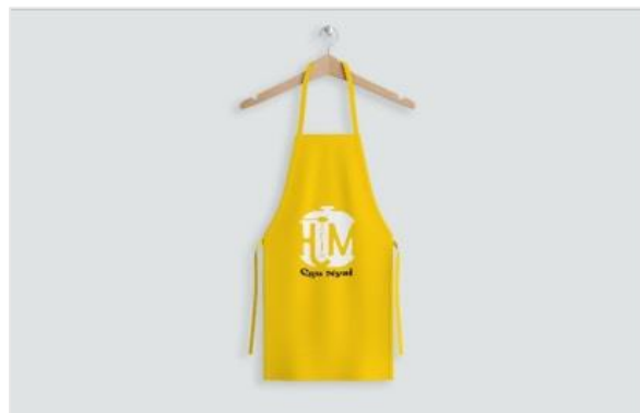
Gambar 2. Apron