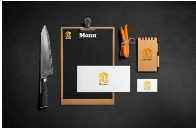
Gambar 6. Stationery.