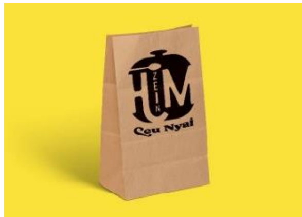
Gambar 5. Paper Craft