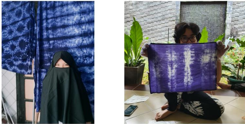
Gambar 4. Hasil Pewarnaan Scarf Teknik Shibori