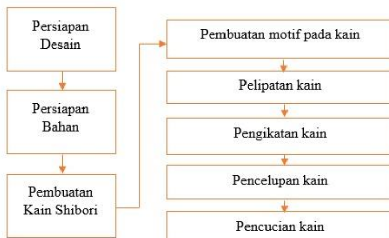
Gambar 1 Tahapan Pewarnaan Tekstil

Pada pelaksanaan kegiatan pelatihan pewarnaan tekstil, menggunakan teknik demonstrasi yang dibuat dalam bentuk video tutorial, sehingga sebelum kegiatan dimulai setiap peserta dikirimkan video dan diberikan waktu untuk menonton 3 jenis teknik shibori, yakni Teknik itajime shibori, Teknik Nui Shibori, dan Teknik Kumo Shibori. Tahapan metode pelatihnannya dapat dilihat pada bagan berikut: