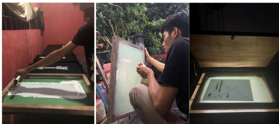
Gambar 1. (Proses Pengambilan Konten Menyablon)