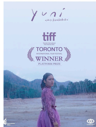
Gambar 1 Poster Film Yuni

mencegah persoalan hamil di luar nikah yang kemudian itu dianggap sebagai membawa aib keluarga.