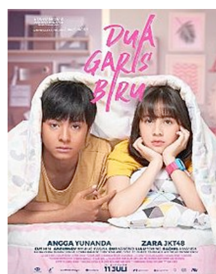
Gambar 2 Poster Film Dua Garis Biru

Belum lagi mitos-mitos yang dilekatkan pada perempuan juga diangkat pada film ini. Jika kita menilik pada film di beberapa tahun yang lampau juga kita pernah disajikan dengan kepopuleran film tema pernikahan dini lainnya yang bahkan menimbulkan pro kontra.